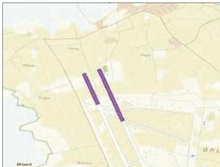
FLYSTRIPA nordover kan bli forlenget med 600 meter.

etter at høringsrunder er avsluttet, det vil si før endelig planforslag legges fram for kommunestyret til egengodkjenning. Saksbehandler anfører at det bør det opprettes en avtale som regulerer dette forholdet mellom kommunen og Forsvarsbygg. Avtalen bør også gi nødvendige avklaringer i forhold til plan- og bygningslovens kap. 15 om innløsning og erstatning innenfor planområdet.